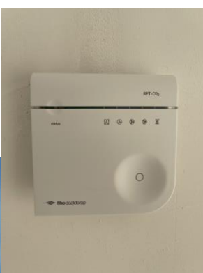
De schakelaar in de woon- en slaapkamer